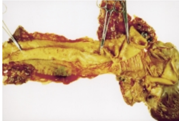
Figura 2. Immagine autoptica. Da destra a sinistra: il ventricolo sinistro, il bulbo aortico e l'aorta ascendente sono state sezionate per visualizzare la dissezione degli strati intimale e medi dell'aorta ascendente dall'avventizia.